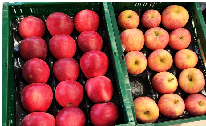
A gauche, Stellar® et à droite, Gala standard, à maturité en Espagne à Mas Badia (même verger) en 2022

Une variété précoce et au goût rafraîchissant qui colorera même en conditions très chaudes et permettra de démarrer la saison commerciale.