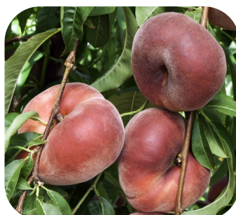
SAUZEE® ZAI010 c.o.v.

La plus productive des variétés de pêches plates, Fruits de calibre 2A/3A, sans défaut pistillaire. Fermeté du fruit et tenue extraordinaires.